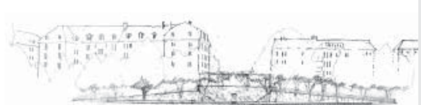
Blick Richtung Breitensteinstrasse